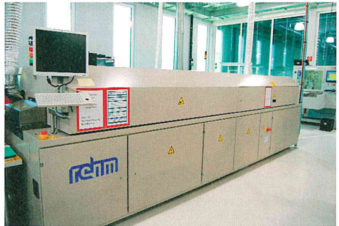
Konvektionslötanlage Rehm VXCnitro 2450, Foto: tecnotron elektronik gmbh

Große Serien mit der Forderung nach kurzen Taktzeiten, aber auch verschiedene Bauteile, die keine Feuchtigkeit vertragen wie z.B. Mikrophone, Kartenlots oder GPS-Empfänger, werden mit herkömmlichen Reflow-Lötanlagen gelötet.